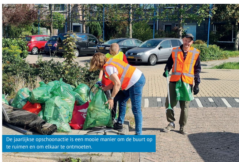
De jaarlijkse opschoonactie is een mooie manier om de buurt op te ruimen en om elkaar te ontmoeten.