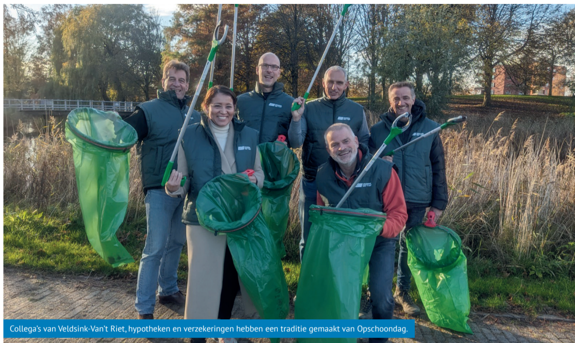
Collega's van Veldsink-Van't Riet, hypotheek en verzekeringen hebben een traditie gemaakt van Opschoondag.

Als er afval achterblijft, wordt dit vermalen in de maaimachine. Dit maaisel dient als voedsel voor vee. En